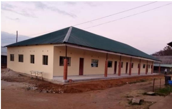
Nieuw gebouw Fysiotherapie

Door de realisatie van dit nieuwe gebouw kunnen de medewerkers van de afdeling Fysiotherapie hun patiënten (ongeveer 2500 per jaar) weer veilig en beter behandelen. Dit leidt tot betere resultaten van de behandelingen van St. Francis' Hospital en dus tot gezondheidswinst voor de bevolking van Zambia. Daarnaast zijn twee belangrijke onderdelen van het ziekenhuis (het medisch archief en de opslag van de apotheek) voor een groot aantal jaren prima gehuisvest. En als extra kan het ziekenhuis de sportzaal gaan gebruiken om inkomsten te verwerven door het geven van sportlessen.