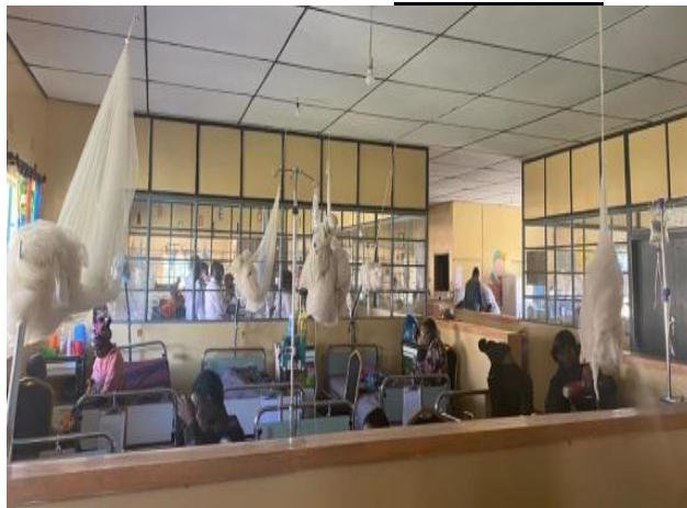
Kinderafdeling in SFH