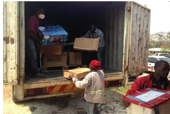
Uitladen van gedoneerde goederen

Na heel veel moeite zijn meer gedoneerde en uit het bedsponsorplan aangekochte goederen met dezelfde deelcontainer in Lusaka aangekomen en daarna door de vrachtauto van het SFH naar Katete gebracht. Mede door de zeer hoge transportkosten heeft het bestuur van de MSG besloten dat wij geen container meer zullen afsturen. Wij reserveren wel nog geld als het management van het SFH een noodkreet stuurt voor de lokale aankoop van b.v. medicijnen.