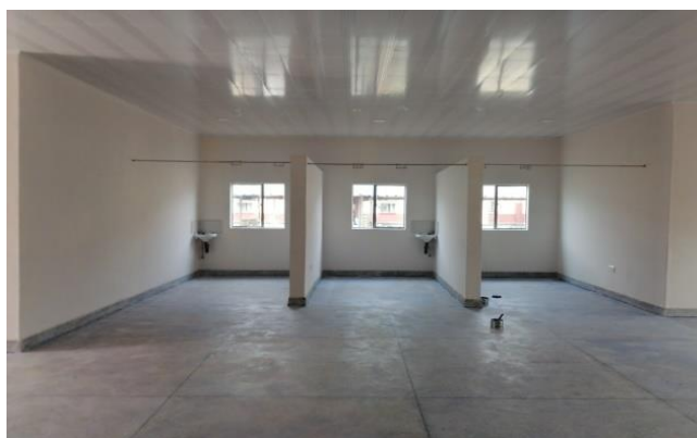
centrale gedeelte van fysiotherapie ruimte