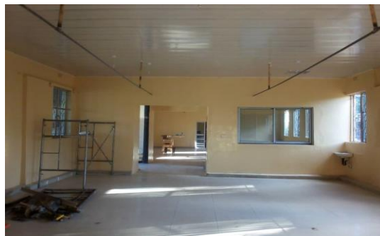
Mannenzaal Minga Mission Hospital