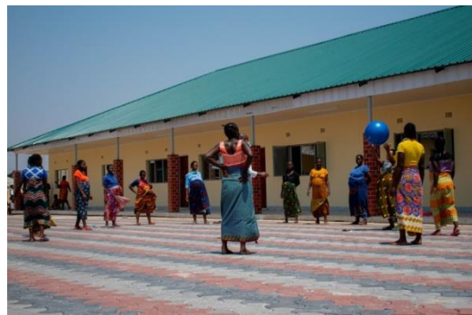
Zwangere vrouwen bij parkeerplaats Fysio