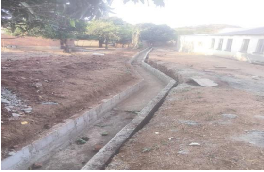
Waterafvoer bij Minga