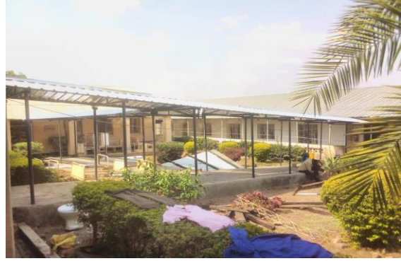
Mannenafdeling Minga met overdekt looppad

In 2020 kocht de MSG uit het Amputee Fund in Nederland gereedschap voor de orthopedisch instrumentmaker in het SFH aan. Deze zijn begin oktober 2021 per container eindelijk gearriveerd. Agness Manda kan nu reparaties aan bestaande prothesen uitvoeren in een speciale ruimte in het nieuwe physiogebouw.